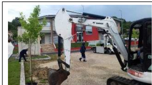
Interramento piante: febbraio 2020