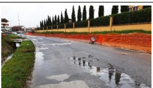
Nuovo marciapiede in fase di realizzazione